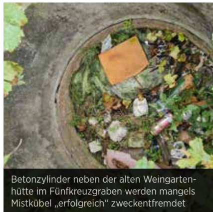
Betonzylinder neben der alten Weingartenhütte im Fünfkreuzgraben werden mangels Mistkübel „erfolgreich“ zweckentfremdet