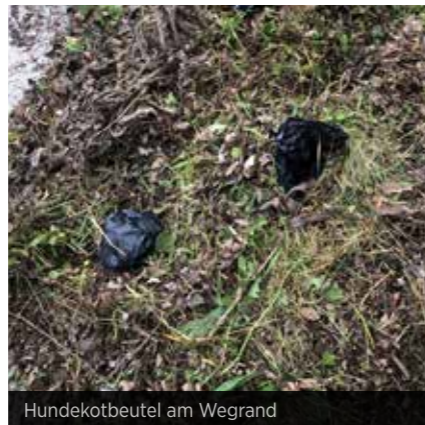
Hundekotbeutel am Wegrand