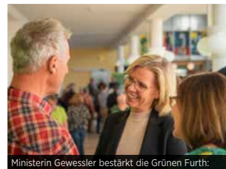
Ministerin Gewessler bestärkt die Grünen Furth:

Greta Thunberg, 'Das Klima-Buch', S. Fischer Verlag; 2022