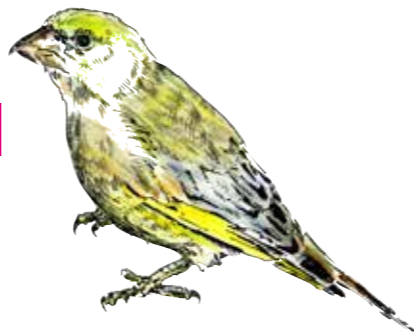
ILLUSTRATION: VALENTIN ROHER

Nun gut, wenn ich mir den lieben und sympathischen Blick sowie nette und liebe Worte zu benutzen gestatte, na ja, und mir einen entspannten Neujahreswunsch zugestehe, dann folgendes: kümmern wir uns nicht um unseren ökologischen Fußabdruck, lassen wir das Klima samt Erwärmung Klima sein, lassen wir es in erster Linie den Autos gut gehen, finden wir Verlust von Lebensräumen bloß funny, verbauen wir den freien Raum schwuppsdiwupps, denken wir bloß in politischen Perioden und maskieren uns nur zu besonderen Anlässen grün.